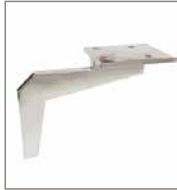
Metallfuß versch. Metallfarben