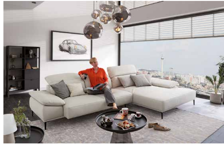
Bezug: Z66/43 greige