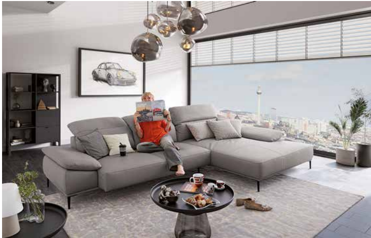
Bezug: Z66/22 elephant