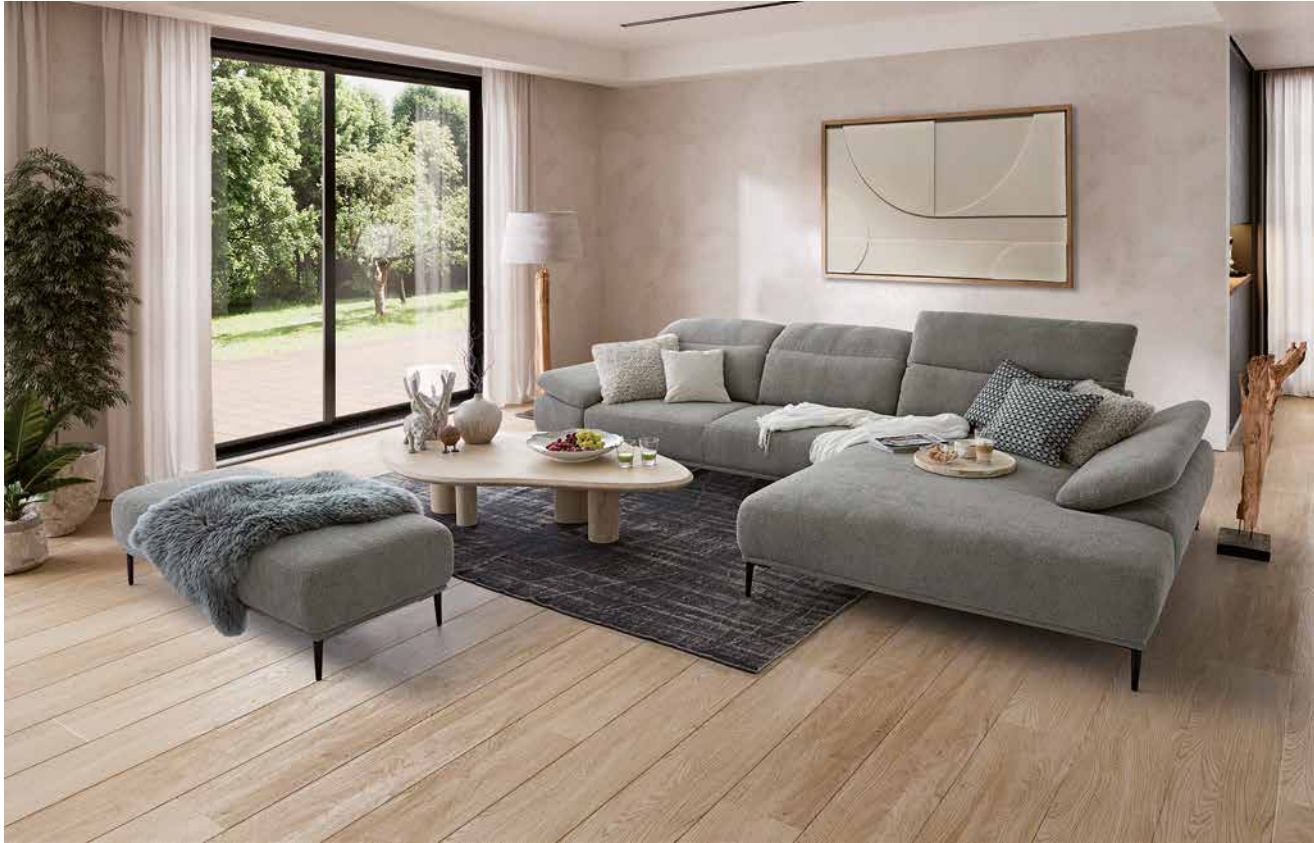
Bezug: S75/32 thyme