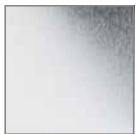
Chrom glän- zend