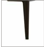
Metallfuß versch. Metallfarben