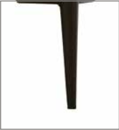
Metallfuß versch. Metallfarben