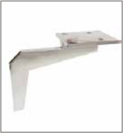
Metallfuß versch. Metallfarben