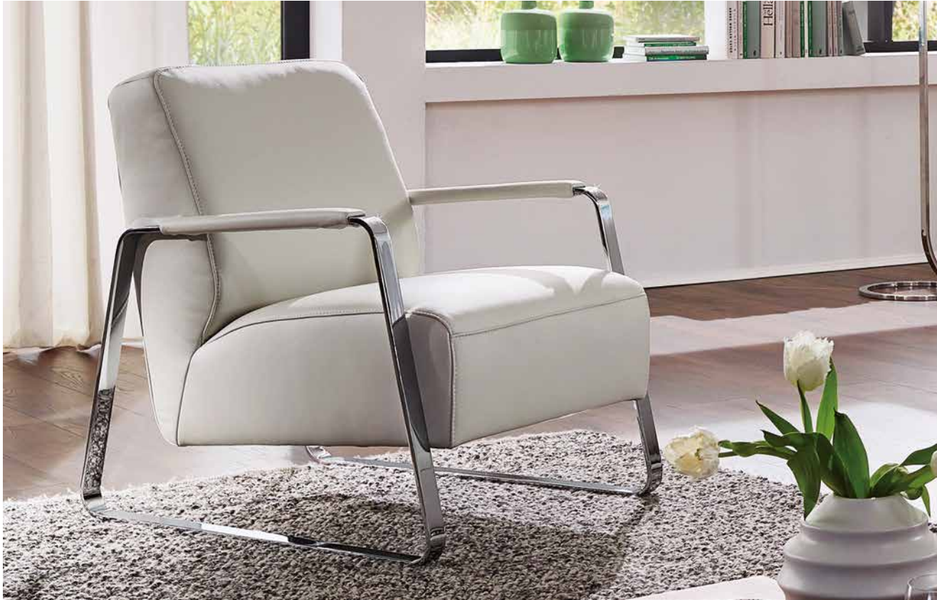
Bezug: Z73/43 cream white