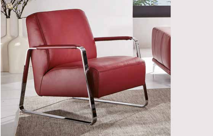
Bezug: Z73/11 ruby red