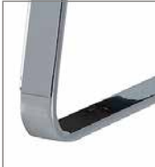
Fußgestell verschiedene Metallfarben