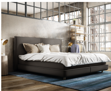
Plattform Box im Milieubild