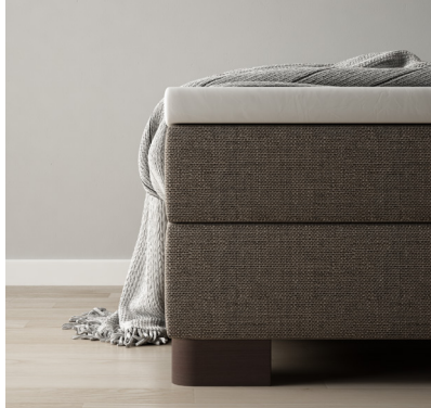
Robust Echtholz Wenge