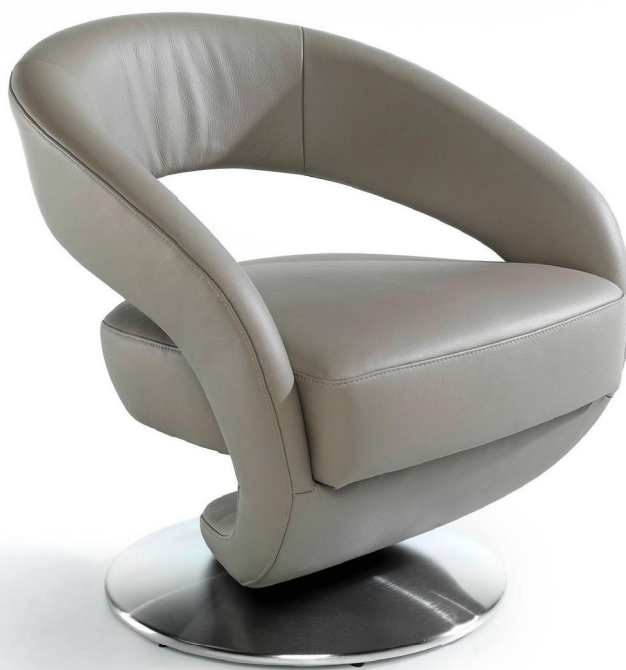
1A Drehsessel mit Drehteller in Edelstahloptik gebürstet