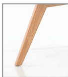
Holzgestell Eiche geölt P58