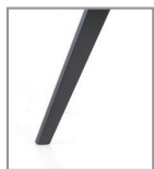
Holzgestell Eiche schwarz P99