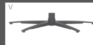
Sternfuß Anthrazit pulverbeschichtet

- alle elektrischen Varianten können mit aussenliegendem Akku geliefert werden.