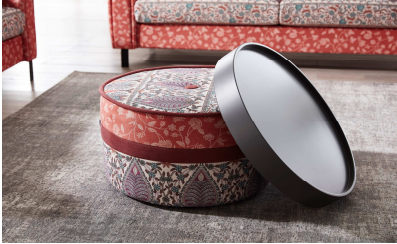
Mit Aufsatztablett in Echtholz lackiert Anthrazit !!!!