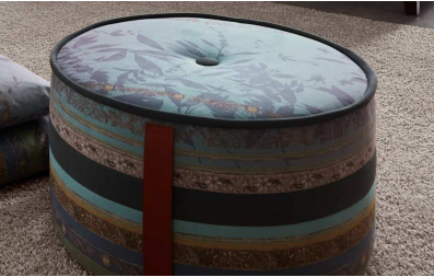
Mit Sattelledergriff !!!