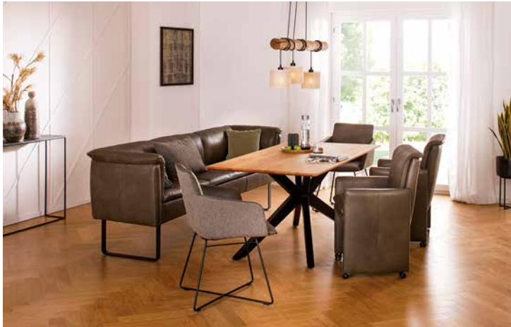
Bezug: Z75/36 camouflage