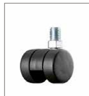
Kunststoff-Doppelrolle (2 cm höher)