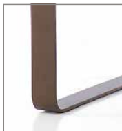
Metallkufe verschiedene Metallfarben