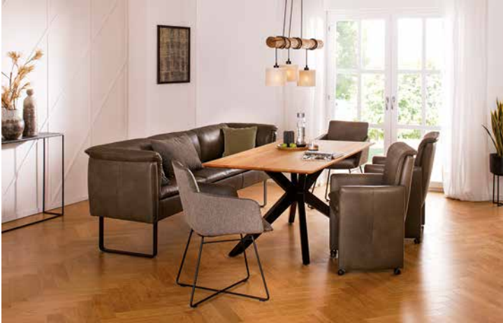
Bezug: Z75/36 camouflage