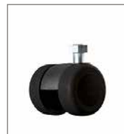
Parkettrolle (2 cm höher)