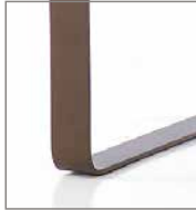
Metallkufe verschiedene Metallfarben