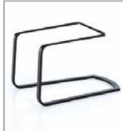
Feischwingergestell verschiedene Metallfarben