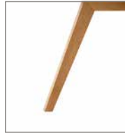
Holzfuß Eiche geölt P58 ohne Mehrpreis F M8