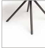
Stativgestell schwarz F 8A