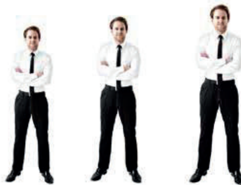
S bis ca. 165 cm M von ca. 165 bis 183 cm L ab ca. 183 cm

Der Sessel ist in jeder Ausführung in den 3 Größen S, M, L erhältlich. Alle relevanten Komfortgrößen (Sitzhöhe, Sitztiefe, Fußklappenlänge, Rückenhöhe) wachsen im Verhältnis mit, angepasst an alle Körpermaße.