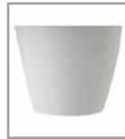
Kunststoffgleiter grau oder schwarz