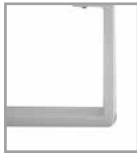
Metallkufe weiß M30 Mehrpreis