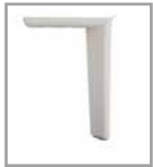
Metallfuß weiß M30