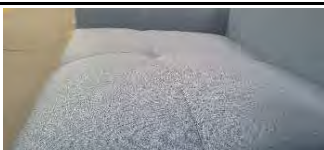
Detail 3: Legere, softe Optik und Komfort mit modelltypischer Faltenbildung