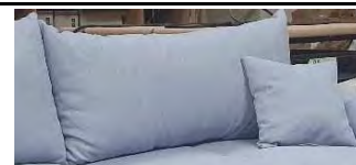
Detail 4: inklusive 2 Rückenkissen + 2 Zierkissen

Gestell: Tragende Teile aus massivem Hartholz, Verbindungen der tragenden Teile verdübelt oder verzapft, Spanplatte, Sperrholz