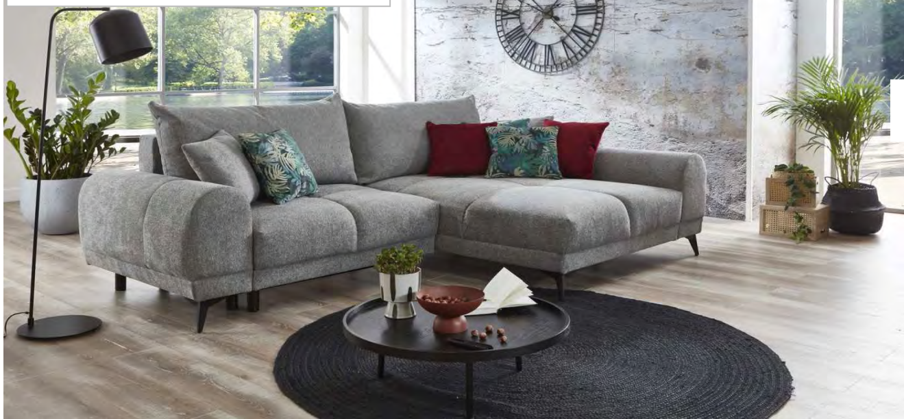
Bild: 2F BK (Li)-Rec (Re) Fuß Metall schwarz / Tula 12 mittelgrau (zusätzliche Zierkissen: Forest 3 grün + Monolith 69 burgund - nicht im Lieferumfang)

Schlaffunktion mit Bettkasten incl. 2 Rückenkissen + 2 Zierkissen in Polsterfarbe