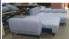
Detail 1: Schlaffunktion mit Bettkasten

Bild: 2F BK (Li)-Rec (Re) Fuß Metall schwarz / Tula 12 mittelgrau (zusätzliche Zierkissen: Forest 3 grün + Monolith 69 burgund - nicht im Lieferumfang)