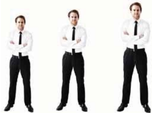
S bis ca. 165 cm

Der Sessel ist in jeder Ausführung in den 3 Größen S, M, L erhältlich. Alle relevanten Komfortgrößen (Sitzhöhe, Sitztiefe, Fußklappenlänge, Rückenhöhe) wachsen im Verhältnis mit, angepasst an alle Körpermaße.