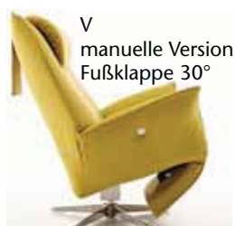
V manuelle Version Fußklappe 30°

Achtung: Das Fußteil der manuellen Funktion V ist nur dann ganz eingeschlagen (15°), wenn der Sessel „besessen“ wird, d.h. mit Körpergewicht belastet und ohne Belastung hat die Fußklappe einen Winkel von ca. 30° - zur Erleichterung der manuellen Auslösung.