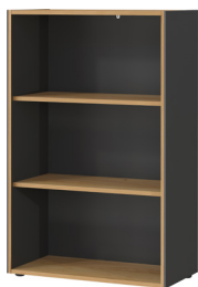
1634-549 B/H/T 75/120/40 cm

Aktenregal in Graphit/Navarra-Eiche-Nb., Melaminharzbeschichtung, hochwertige ABS-Kanten, Filigrane Dualkante, Kunststoffmöbelgleiter in schwarz