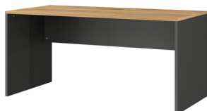
1587-549 B/H/T 158/75/79 cm

Schreibtisch in Graphit/Navarra-Eiche-Nb., Melaminharzbeschichtung, hochwertige ABS-Kanten,