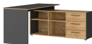
1621-549 B/H/T 147/75/145 cm

Winkelschreibtisch in Graphit/Navarra-Eiche-Nb., Melaminharzbeschichtung, Filigrane Dualkante, hochwertige ABS-Kanten, Selbsteinzug der Schubladen, Bügelgriffe aus Metall, Kunststoffmöbelgleiter in schwarz