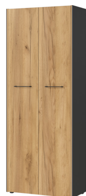
1649-549 B/H/T 75/196/40 cm

Aktenschrank in Graphit/Navarra-Eiche-Nb., Melaminharzbeschichtung, hochwertige ABS-Kanten, Filigrane Dualkante, Türdämpfung, Kunststoffmöbelgleiter in schwarz