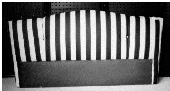
Bsp. 1: Kopfteil bogenförmig, d.h. Streifen können nicht rapportgerecht verarbeitet werden.

Modellbezogene Einschränkungen finden Sie jeweils im Kopf der entsprechenden Preislistenseite unter der Rubrik "Stoffaufteilungen". Bitte berücksichtigen Sie diese Hinweise, da der Musterverlauf bei dem entsprechenden Bauteil unschön wirken würde.