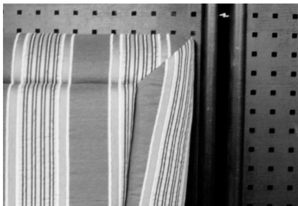
Bsp. 2: Kopfteil mit seitlicher Gehrungsnaht; keine rapportgerechte Verarbeitung möglich.

Beispiel: Stoff nicht geeignet für Kopfteile