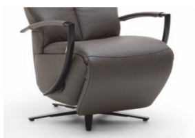
Armteil 3 Chrom/ schwarz matt gegen Aufpreis