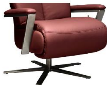
Armteil 4 gegen Aufpreis