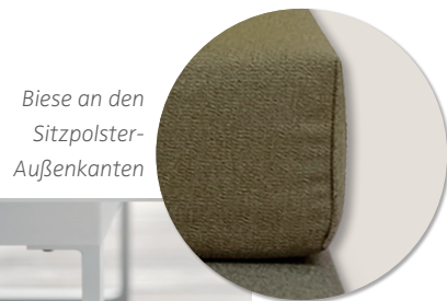
Biese an den Sitzpolster-Außenkanten

Bestellbare Fußausführungen: Metallfuß FY1 weiß oder Metallkufe F 15 weiß (gegen Mehrpreis). Bitte bei Bestellung angeben.