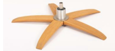
WSK Holzstern Fuß Schwarz