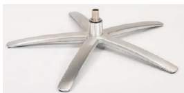
SB Sirius Base - Silver

Für alle Fußvarianten EB/EBS und SB/SBS Gaslift-Höhenverstellungs-Option möglich.