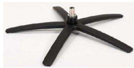
SBS Sirius Base - Schwarz