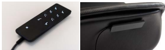
Kabelgebundene Fernbedienung Sessel 4-Motoren + Massage.