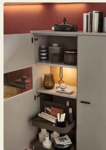
Komfort-Tablarauszug: Mit dem Komfort-Tablarauszug kannst Du wertvollen Stauraum in Siedeboard und Schrank nutzen. Die Auszüge kommen auch bei Öffnen der Tür entgegen, so dass ihr bequem von oben hineingreifen und Sachen verstauen können – damit gehören schlecht zugängliche Ecken im Schrank der Vergangenheit an.