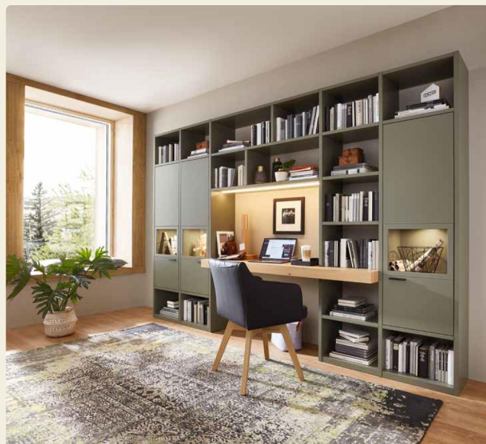
Regalkombination 40745, B/H/T ca. 320,3/215,7/492 cm