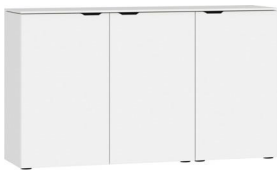
Kommode Typ 19