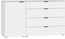
Kommode Typ 15