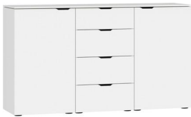
Kommode Typ 17