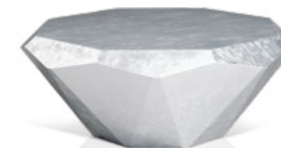
R 145 S ▶ 103 cm ▼ 103 cm ▲ 40 cm