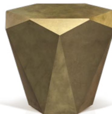
R 145 MA ▶ 103 cm ▼ 103 cm ▲ 40 cm