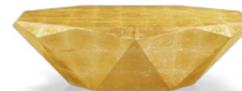
J 145 G ▶ 138 cm ▼ 78 cm ▲ 40 cm