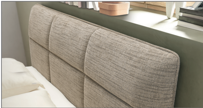
Kopfteil gesteppt mit Keder