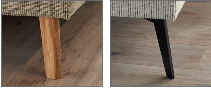
Holzfuß massiv, eichefarbig Metallfuß schwarz lackiert