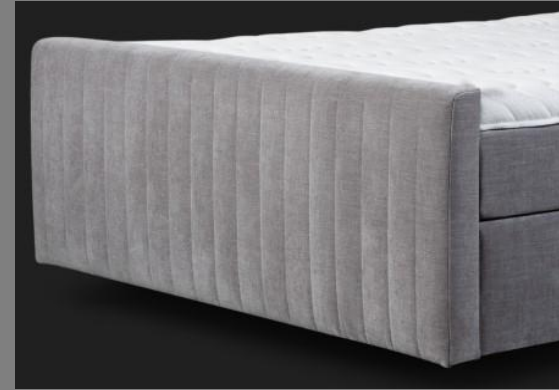
FT Topmotion 14