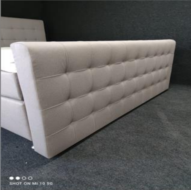
FT Space III