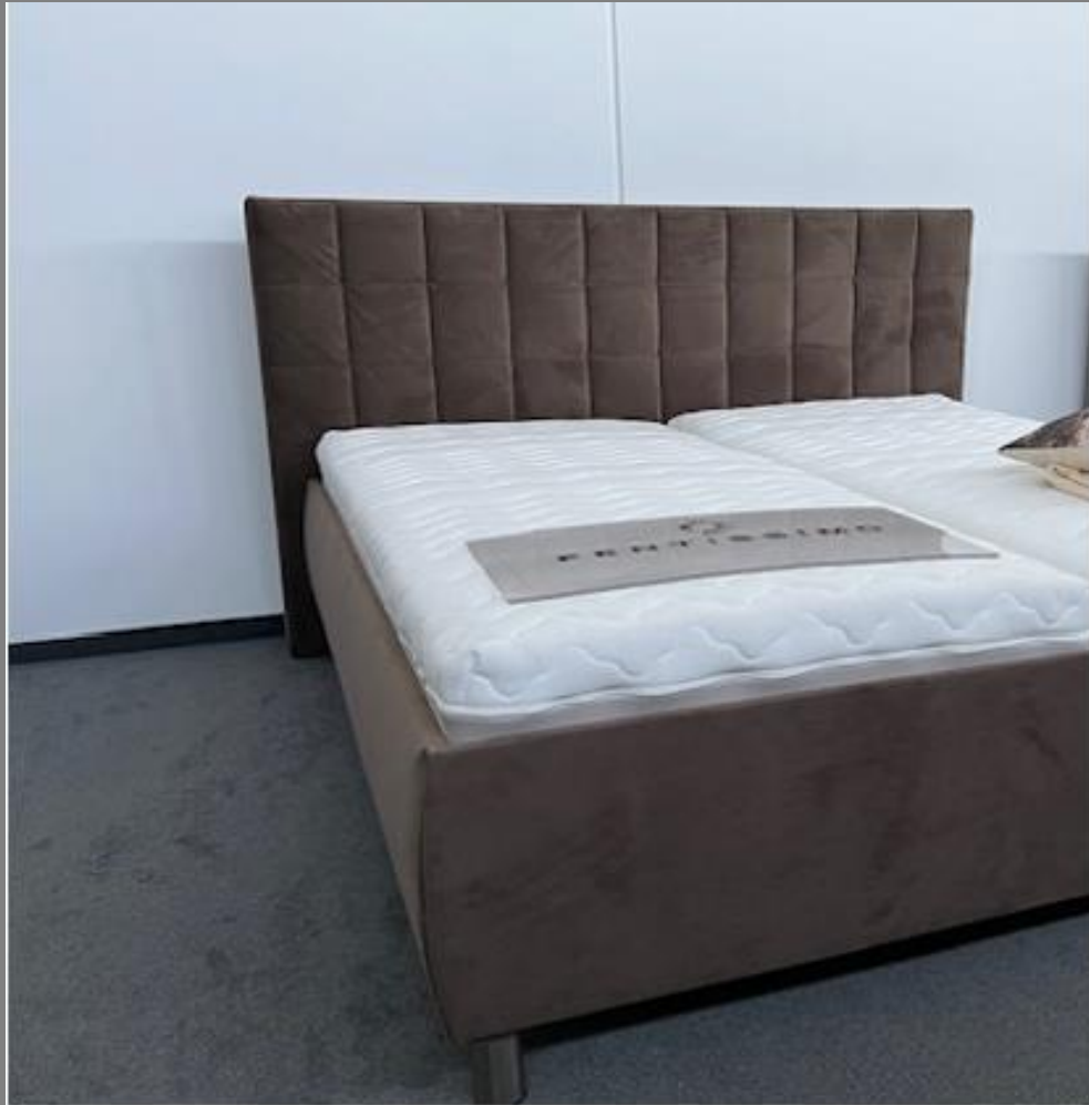
KT TM 17