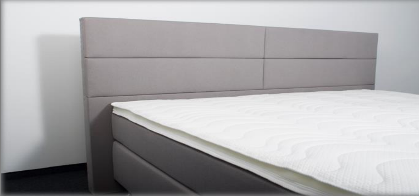
KT Space I