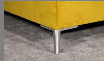
Urban Alu gebürstet