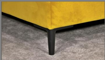
Urban schwarz matt