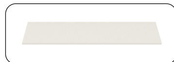
Einlegeböden Breite 45 und 90 cm