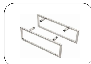
Möbelkufen Schwarz matt und edelstahlfarbig