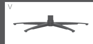
V Sternfuß pulverb. Anthrazit