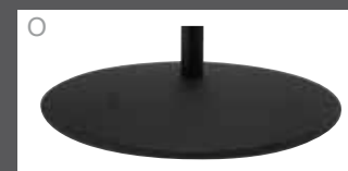
O Teller pulverb. beschichtet Anthrazit