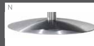
N Teller Edelstahl-Optik