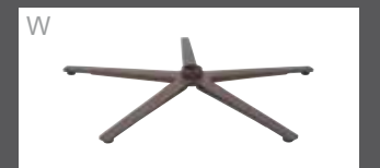
W Sternfuß pulverb. Bronze