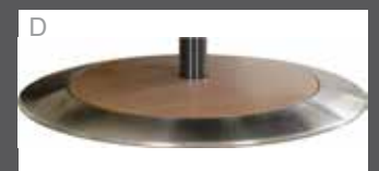
D Teller Holz mit Edelstahlring