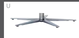
U Sternfuß Edelstahl-Optik