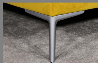
Wing silber matt