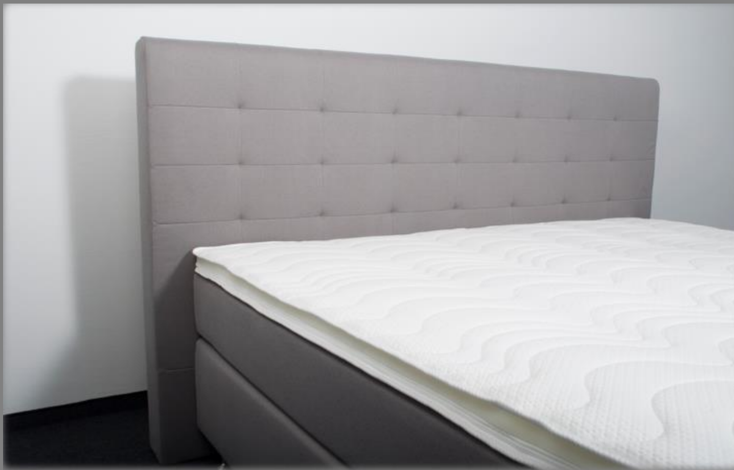
KT TM 1