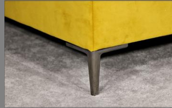
Urban schwarz Chrom