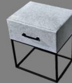
Nchttisch Fame La