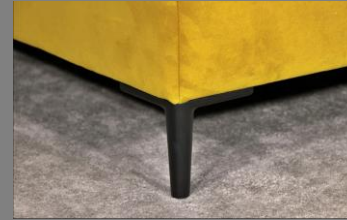
Urban schwarz matt