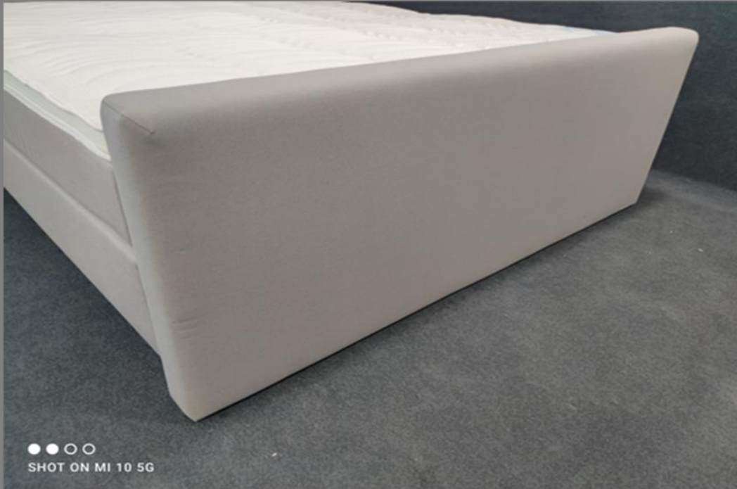
FT Space 1