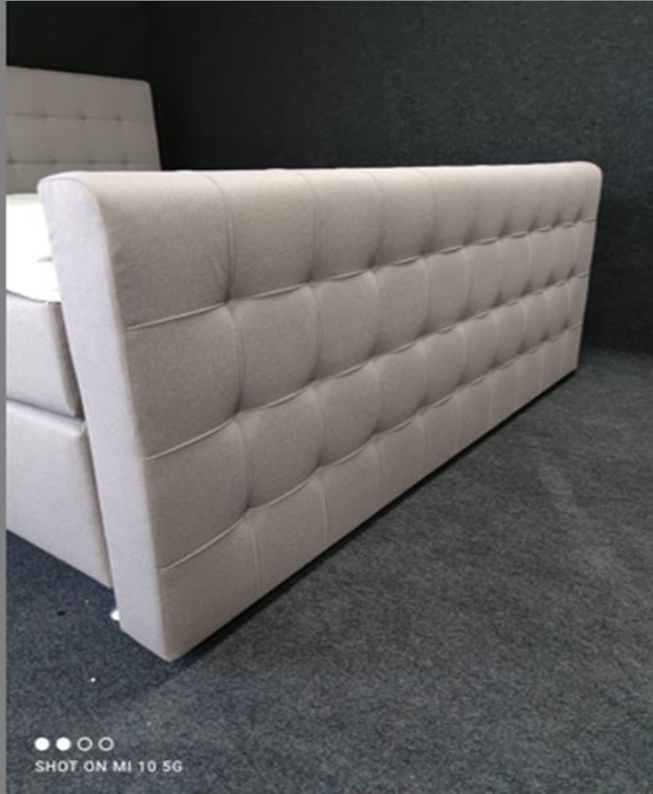
FT Space 3