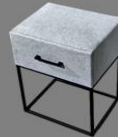
Nachttisch Fame La