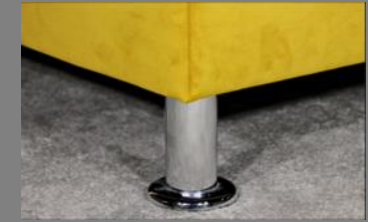
Vitalis Alu rund