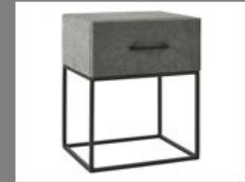
Nachttisch Frame La