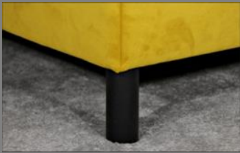
Holz rund schwarz