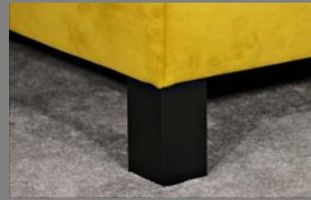
Holz viereckig schwarz