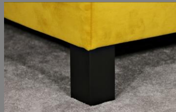
Holz viereckig schwarz