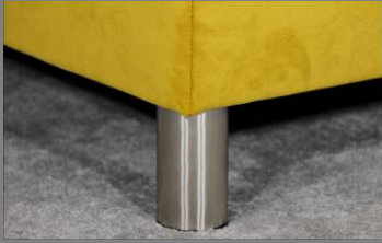
Alu rund poliert