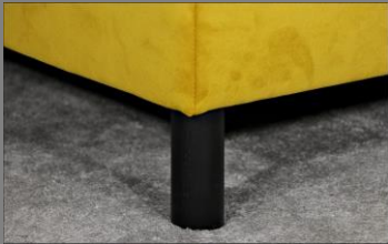
Holz rund schwarz