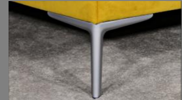
Wing silber matt