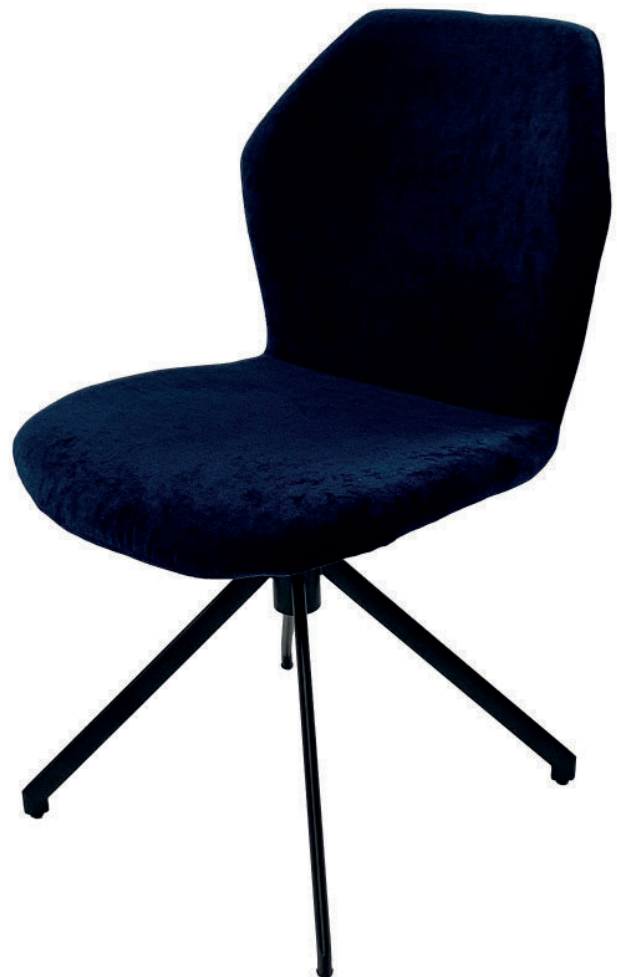
Art.-Nr. 21 26 236 Bezugsmaterial: Stoff Feltrato Oxford Gestell Spinnenfuß: Schwarz gepulvert