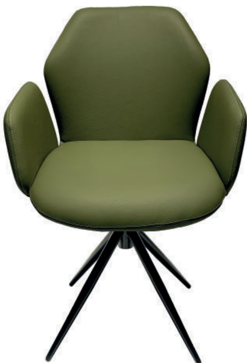
Gestell 4-Fuß konisch