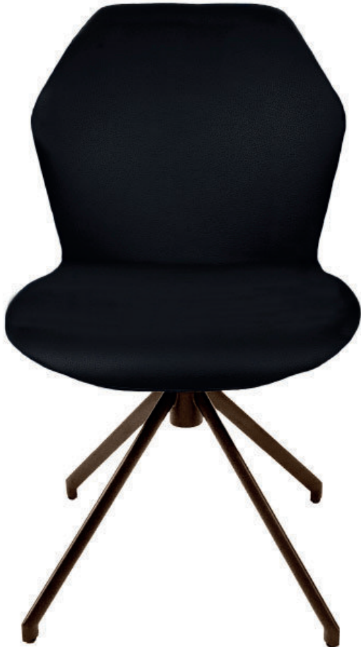
Art.-Nr. 21 26 233 Bezugsmaterial: Leder TOLEDO „Nero“ Gestell Spinnenfuß: Bronze gepulvert