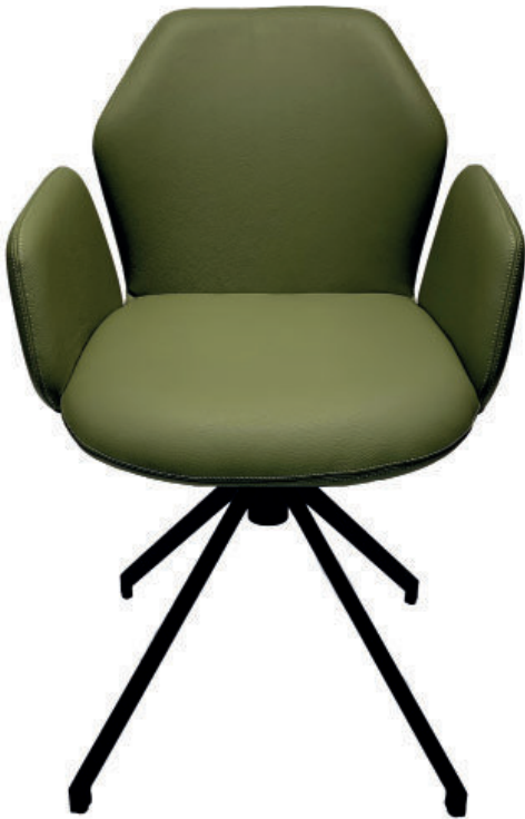
Art.-Nr. 21 26 184 Bezugsmaterial: Leder TOLEDO „Apple green“ Gestell Spinnenfuß: Schwarz gepulvert