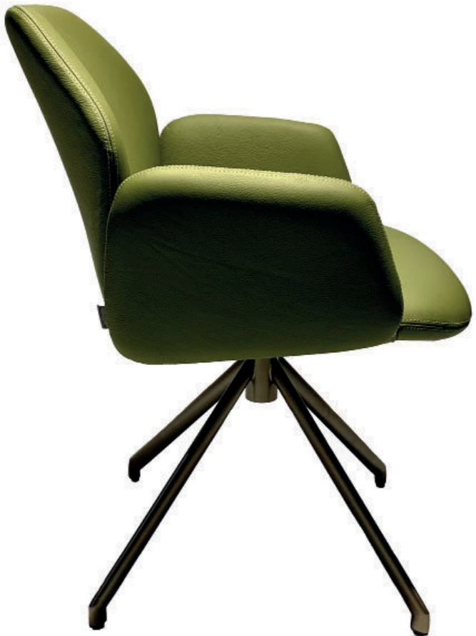
Art.-Nr. 21 26 185 Bezugsmaterial: Leder TOLEDO „Apple green“ Gestell Spinnenfuß: Bronze gepulvert