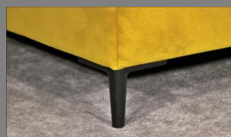
Urban schwarz matt