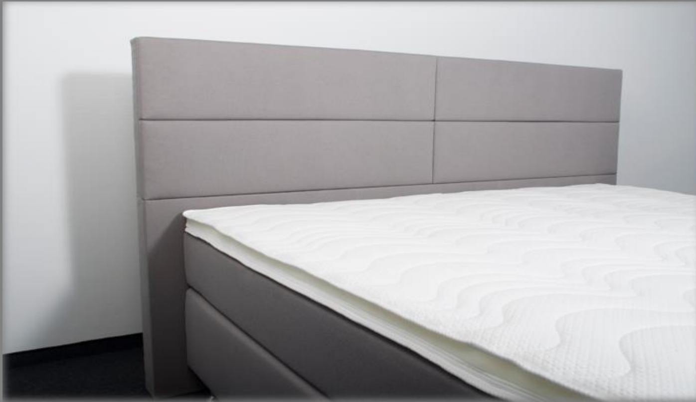
KT Space 1