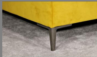
Urban schwarz chrom