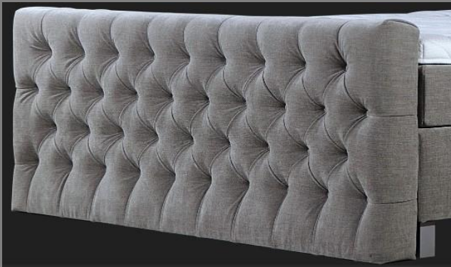
FT Topmotion 5