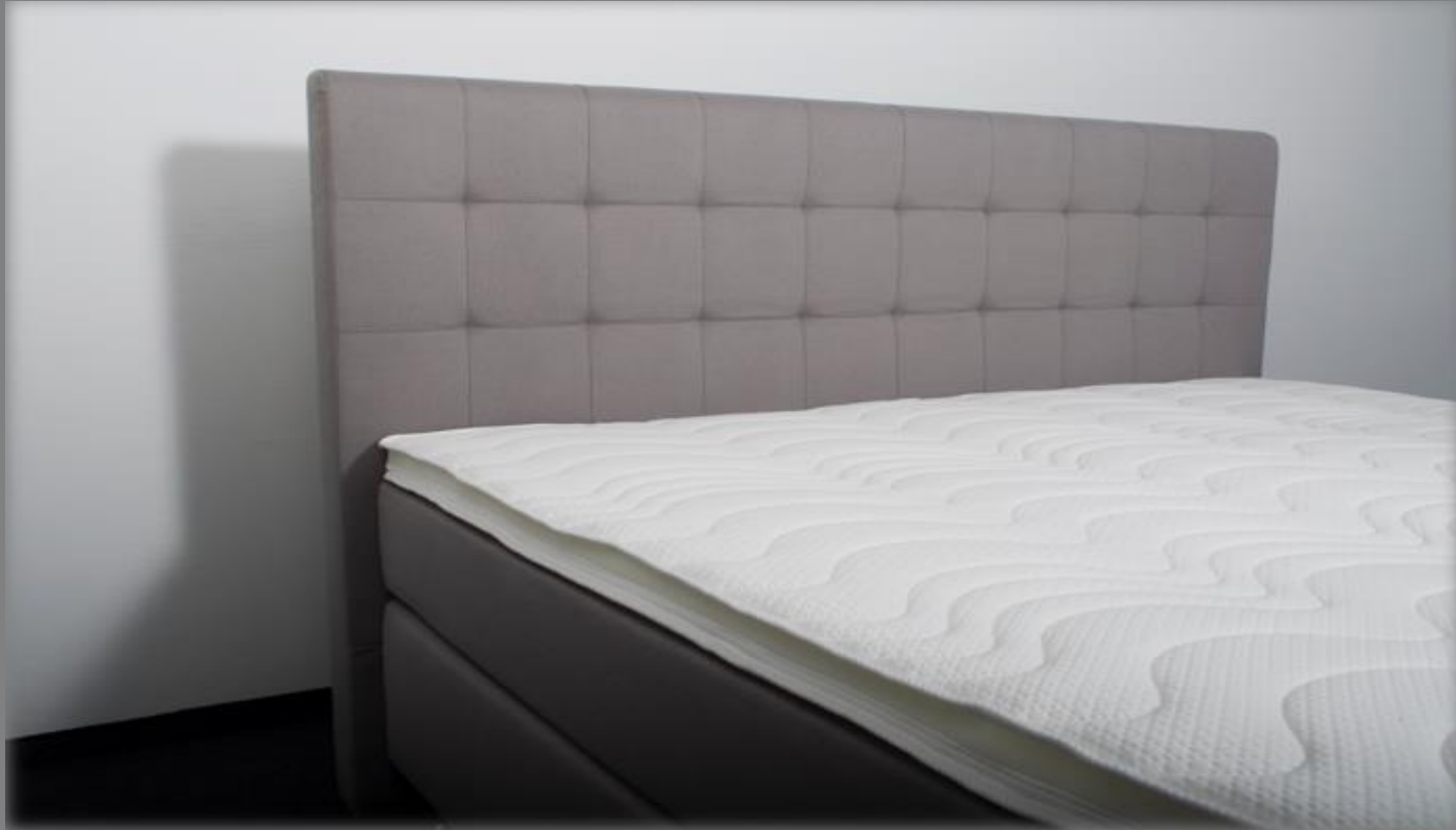
KT Space III