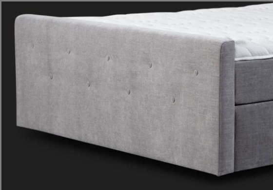
FT Topmotion 15