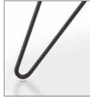
Haarnadelgestell schwarz pulver- besch. F 11