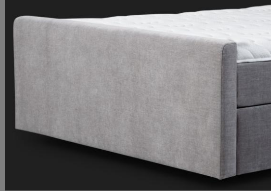
FT Topmotion 13