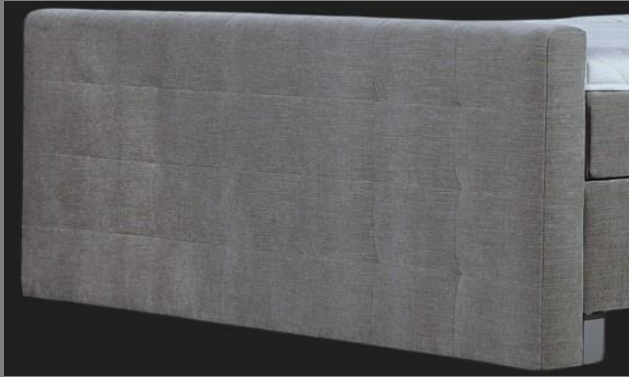
FT Topmotion 1