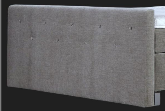
FT Topmotion 12