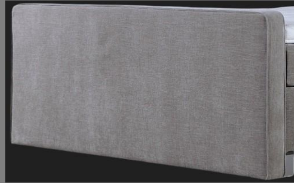
FT Topmotion 2