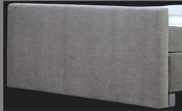
FT Topmotion 10