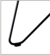
Haarnadelfuß schwarz pulverbe- schichtet