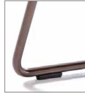
Drahtrohrgestell schwarz pulver- besch.