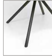
Stativfuß fest schwarz